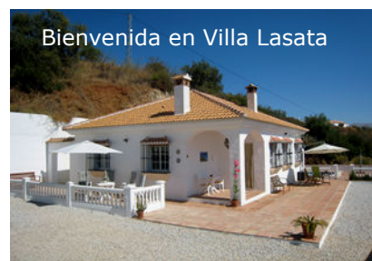
Bienvenida en Villa Lasata

Voorkom teleurstelling en wacht daarom niet te lang met boeken.